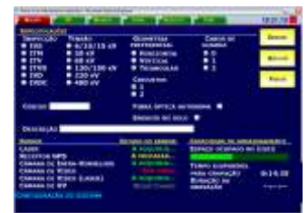
Figura 1 - Misión

El interfaz es siempre adaptado a las necesidades de cada cliente.