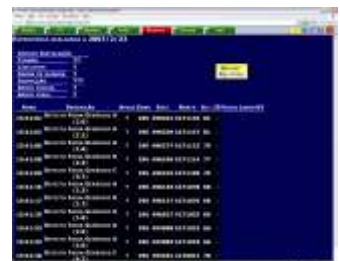
Figura 3 - Informe