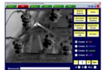
Figura 2 - Termografía